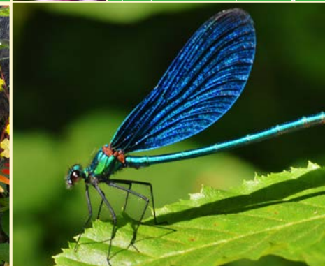
Blaüflügelige Prachtlibelle ( Calopteryx virgo ) im Aromagarten