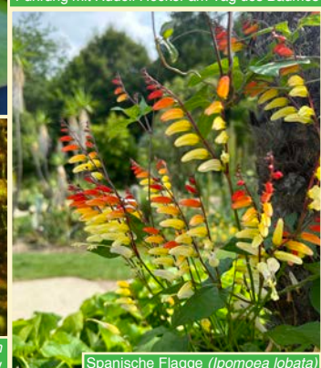
Spanische Flagge ( Ipomoea lobata )