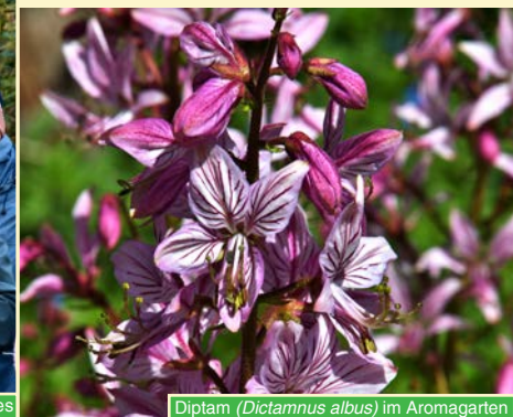
Diptam ( Dictamnus albus ) im Aromagarten