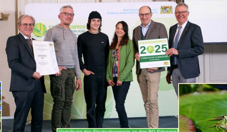
Verleihung des Staatsehrenpreis an den BG Erlangen